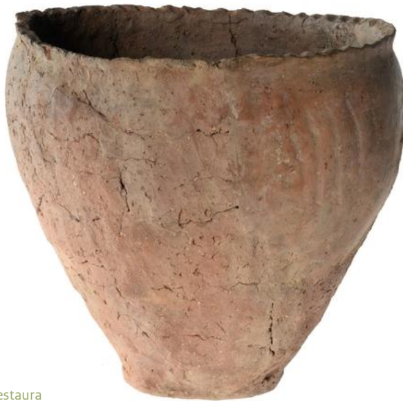
Weert, Museum W / Restaura

In een urnenveld zijn de overledenen onder een eigen, kleine heuvel begraven. Vaak is het lichaam gecremeerd waarna de resten zijn verpakt in een aardewerken pot, een urn.