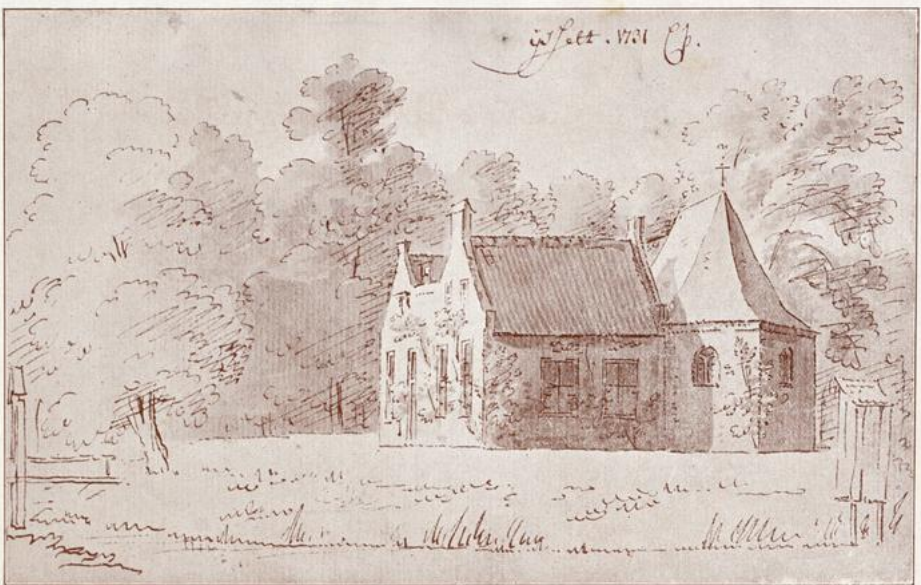
RIDDERHOFSTAD IJSSELT.

Gezicht op de kapel en het huis Isselt, te Amersfoort zoals getekend door C. Pronk in 1731.