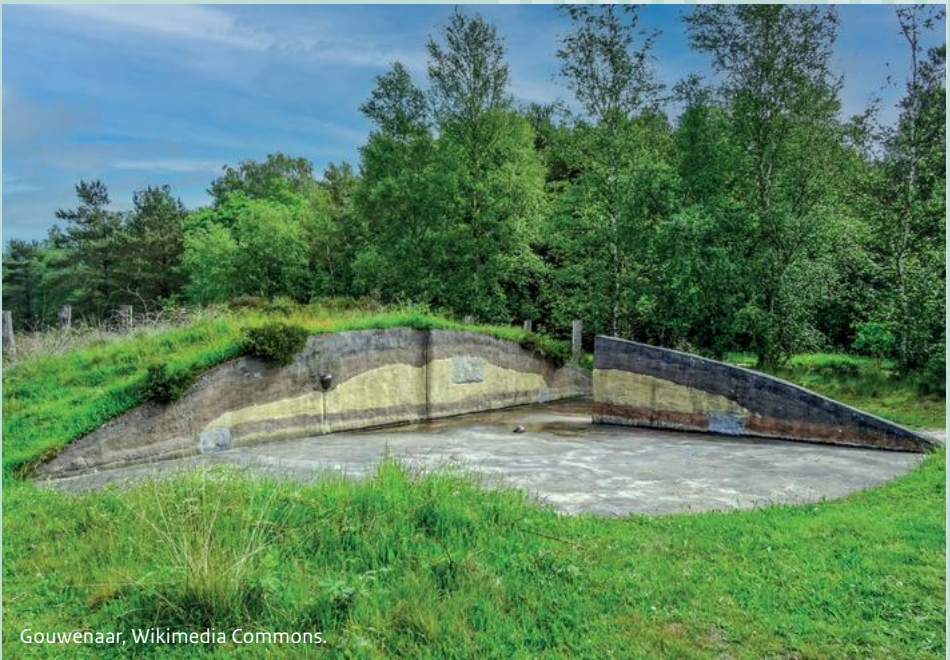
Gouwenaar, Wikimedia Commons.

Reconstructie van een grafheuvel bij Vierhouten. In de doorsnede is te zien dat het heuvellichaam nogmaals is opgehoogd en dat onder en in deze grafheuvel verschillende overledenen zijn bijgezet.