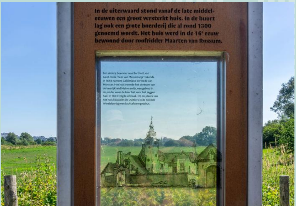
Het informatiebord vertelt over de geschiedenis van kasteel Meinerswijk met bijzondere bewoners als roofridder Maarten van Rossum en Barthold van Gent die namens Gelderland de vrede van Münster tekende.