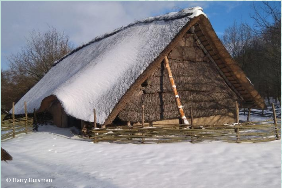
Het gereconstrueerde huis in het Openlucht-museum Swifterkamp in Flevoland, geeft een impressie van bewoning in de late steentijd in Almere.