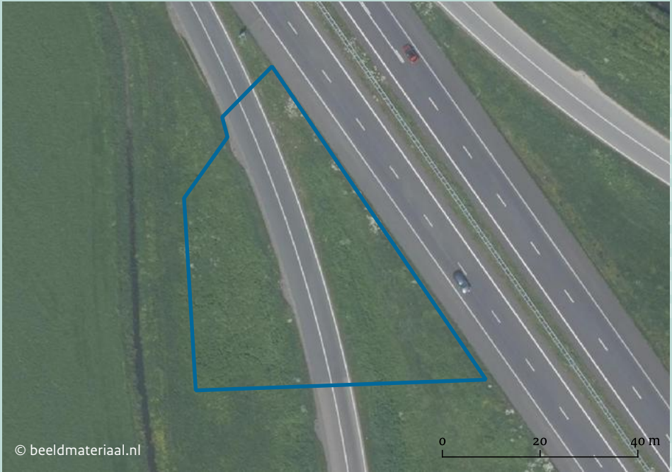
Het rijksmonument ligt dieper in de ondergrond en is ook onder het wegtracé behouden gebleven.