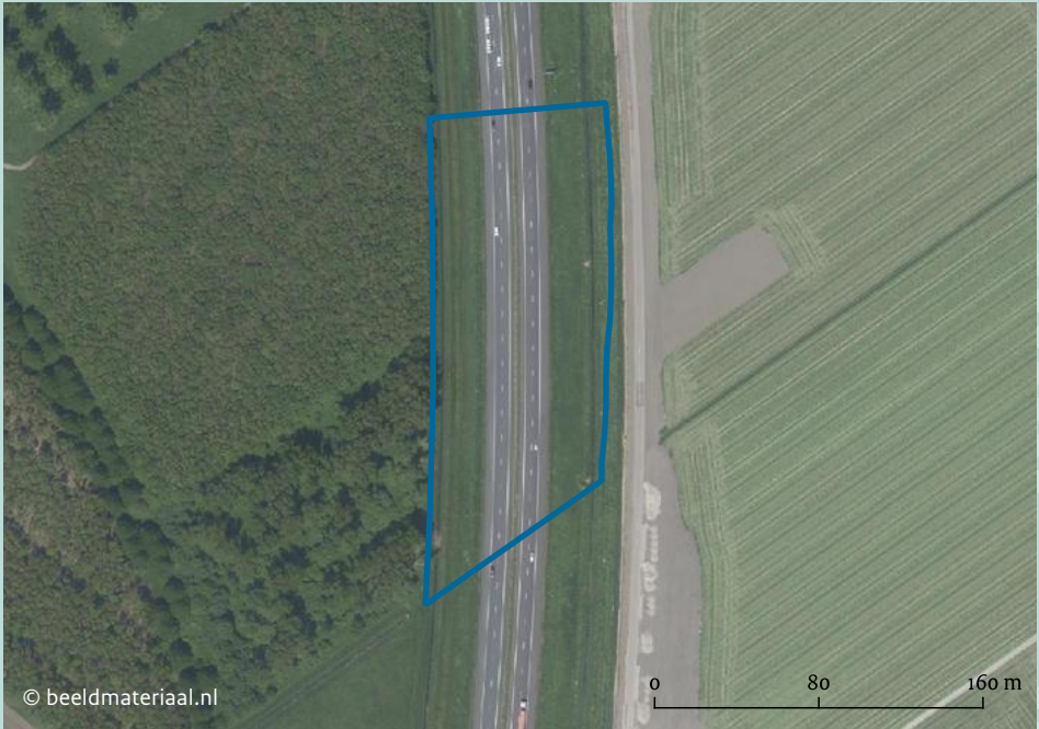
Het rijksmonument ligt dieper in de ondergrond en is ook onder het wegtracé bewaard gebleven.