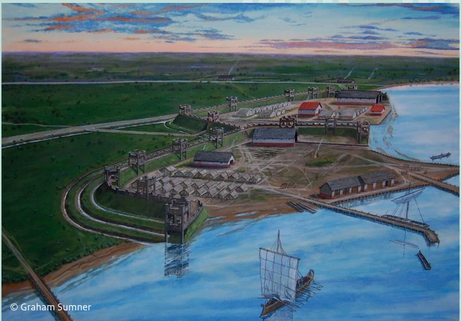
Impressie van Castellum Flevum, het fort en de haven van Velsen op deze strategische plek aan de noordgrens van het Romeinse rijk.