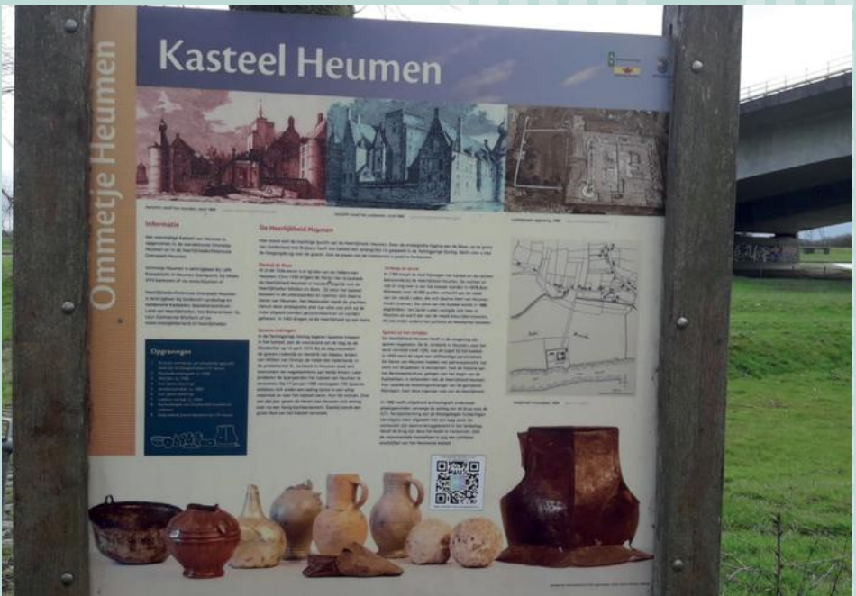
Informatiebord op het kasteelterrein. Het 13e eeuwse kasteel raakte in de 16e eeuw in verval, werd begin 18e eeuw herbouwd en rond 1800 gesloopt.