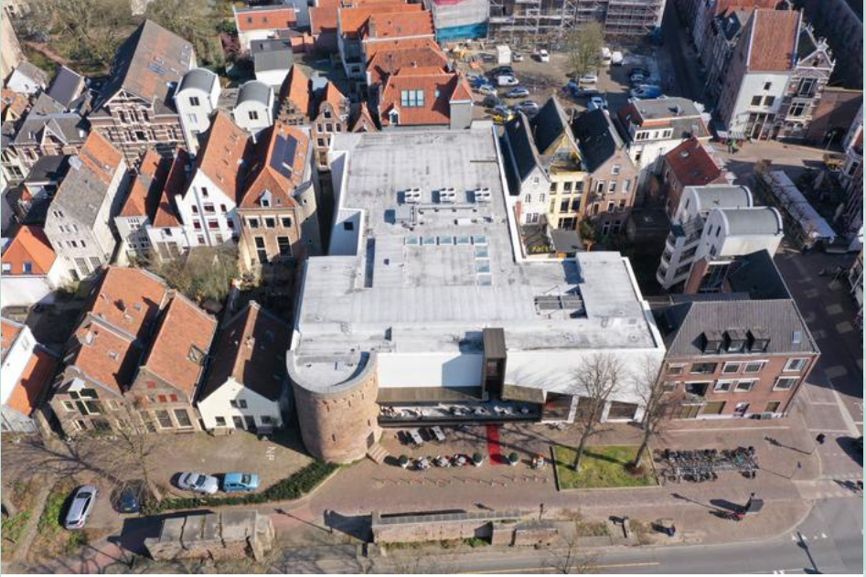
De hoektoren van de voormalige 13e eeuwse vispoort staat nog overeind. Onder maaiveld bevinden zich archeologische resten van de Karolingische tijd tot de tijd van de Hanzesteden.