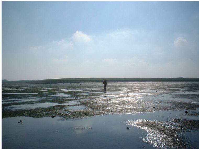
Veldwerk in de Oosterschelde

In de Zandkreek – zuid is de situatie nog steeds stabiel. Het klein zeegras komt voor in niet volledig aaneengesloten vlakken (soms zeer dicht maximaal 95%). Langs de dijk en het schor bevindt zich een strook met zeesla en groenwier. Daarna volgt een zone met weinig bedekking (mengsel van groenwier, zeesla en weinig zeegras). Vervolgens een strook met enkele zeegrasvelden. Daarna weer een minder bedekte strook en tenslotte een zone met zeesla (fijne langwerpige bladeren) en groenwier dichterbij de vaargeul toe.