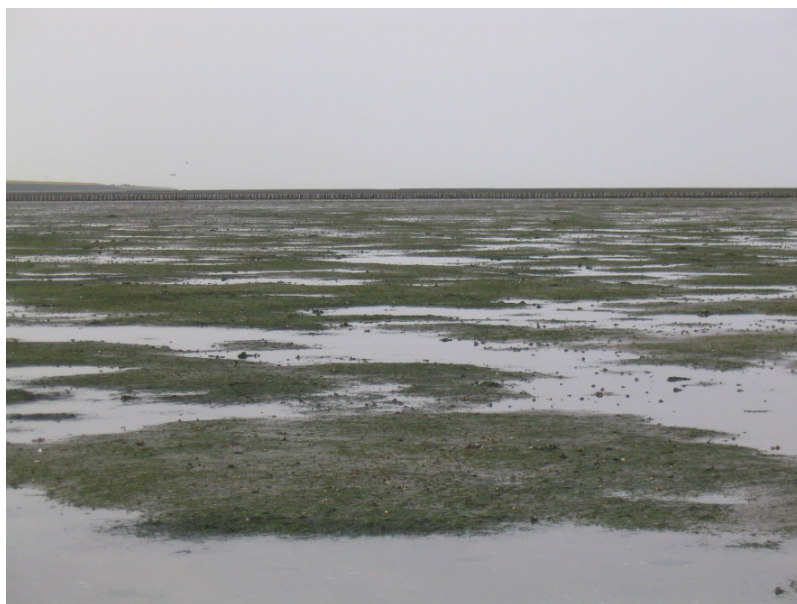
Zostera nolti velden langs de Groninger kust

Het areaal met Klein zeegras ( Zostera noltii ) langs de Groninger kust is, met name bij het Gasstation, ook dit jaar weer toegenomen. Ook ten westen van Noordpolderzijl is wederom een lichte uitbreiding waargenomen ten opzichte van 2003. Op de overige locaties waar Klein zeegras aangetroffen wordt blijft het dit jaar over het algemeen stabiel.